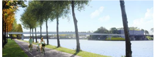
Toekomstbeeld Nieuwe Heemstederbrug.

Zomer 2015 zullen fietsers tussen Houten en Nieuwegein gebruik kunnen ma-