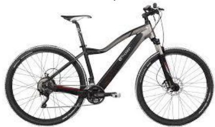
Voorbeeld van een speed-pedelec

De Fietzersbond Houten zal hierbij een belangrijke rol spelen, zowel in begeleidingsgroep als bij de uitvoering van het infra-onderzoek. Uiteindelijk zal de scan een advies aan de gemeente opleveren dat zal worden verwerkt in het nieuwe Verkeersveiligheidsplan en wellicht ook tot aangescherpte normen voor onze hoofdfietspaden.