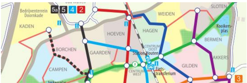
Deel van het meest recente kaartontwerp

We moeten dus nog even geduld hebben. Echter de procedure loopt, en uiteindelijk komen we er wel.