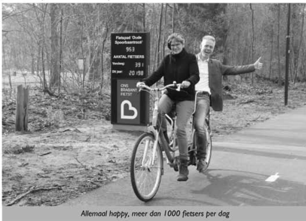
Allemaal happy, meer dan 1000 fietsers per dag

We hebben wel nog enkele wensen over het tracé. Ondanks controle door de gemeenten, wordt het pad toch nog gebruikt door brom- en snorfietsen. Verder zit de chicane in Waalre ons dwars en pleiten wij voor een goede aansluiting op de Burgemeester Mollaan in Waalre. We hebben onze wensen bij de gemeente neergelegd.