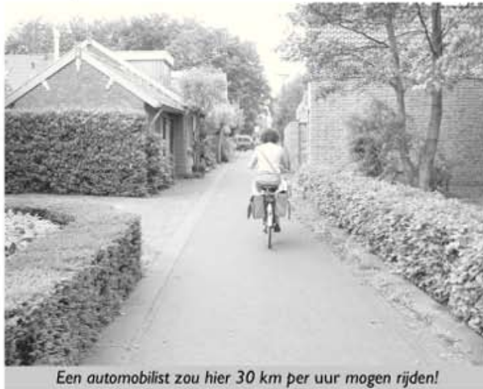
Een automobilist zou hier 30 km per uur mogen rijden!

Gemert fietst, graag zelfs, met mooi weer, op de e-bike, met de renfiets, de bak- en schoolfiets, de boodschappenfiets en de moederfiets. Maar toch... alles bij elkaar opgeteld, komen we toch wel aan een flink aantal verbeterpunten. En dan hebben we het nog niet gehad over de kerkdorpen Handel, Milheeze, De Rips, Elsendorp en Bakel!