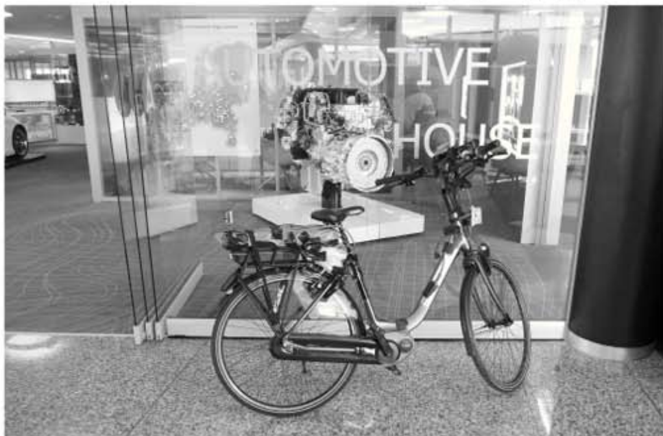
Hier is hij dan, de intelligente fiets

Daarnaast heb ik ook instabiliteit als knelpunt genoemd bij oudere fietsers, maar daar is men (nog) niet op ingegaan.