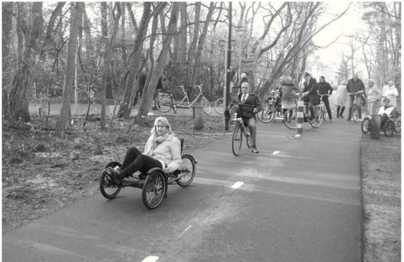
Net een stelletje scholieren