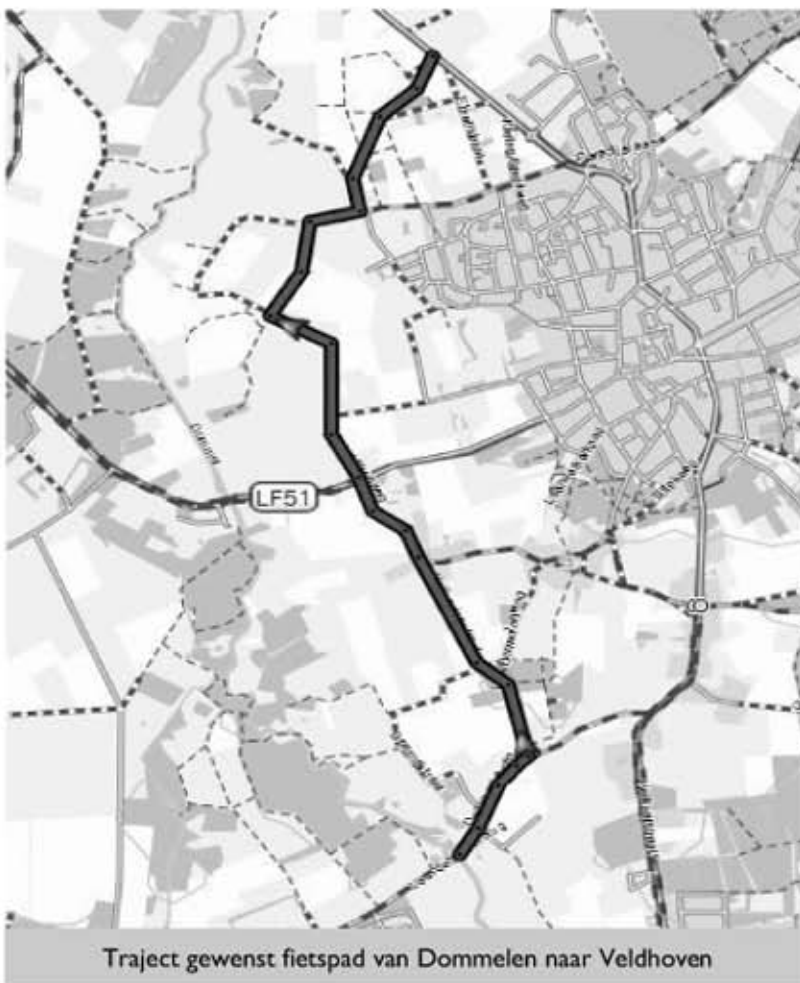
Traject gewenst fietspad van Dommelen naar Veldhoven