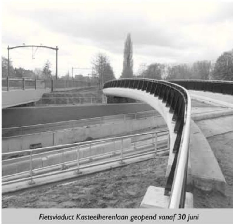
Fietsviaduct Kasteelherenlaan geopend vanaf 30 juni

Het zou zo mooi zijn, als de tunnel in de Collse Hoefdijk aangelegd zou kunnen worden met de bespaarde middelen voor de Ruit: een ongelijkvloerse kruising onder de spoorlijn door, zodat het fietspad langs de spoorlijn op maaiveld kan blijven liggen, zoals bij de Kasteelherenlaan. Dat kan een mooie impuls zijn voor een voortvarender aanpak van het snelfietspad.