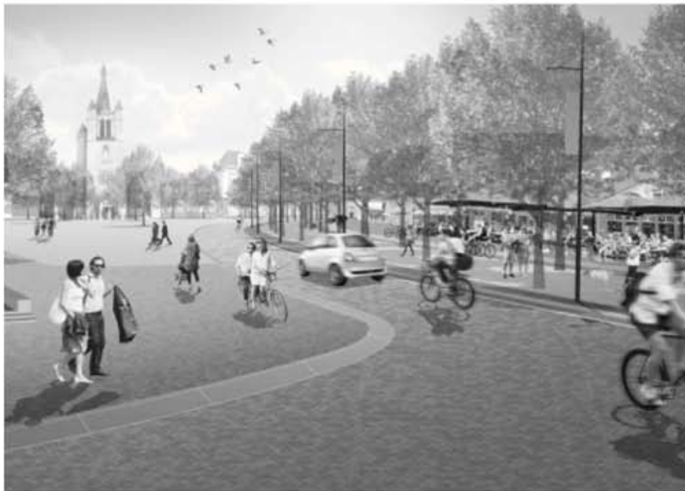
De Markt, een droom wordt werkelijkheid (in 2020)

Na jarenlange discussies, procedures en bezwaren, is het nieuwe fietspad over de Oude Spoorbaan tussen Valkenswaard