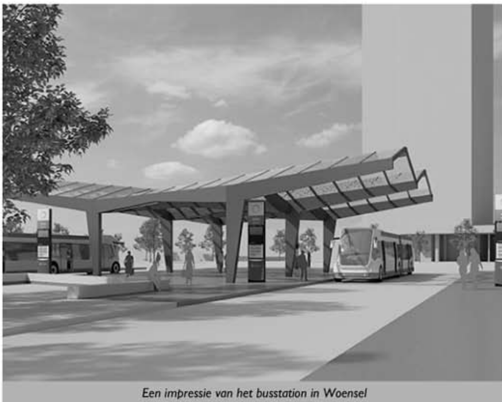
Een impressie van het busstation in Woensel

Het Bereikbaarheidsakkoord bevindt zich op dit moment (half mei) in de afrondende fase: eind mei is er een zogeheten 'fusiebijeenkomst' waar het eindconcept gepresenteerd gaat worden. Vervolgens gaat het nog de politieke mallemol in: eerst een definitief stuk door de MRE dat na de zomervakantie wordt besproken in de gemeenteraden. Voor de Fietzersbond, niet alleen in Eindhoven maar in alle gemeenten in de regio, ligt hier nog een taak om ook de lokale politici te winnen voor dit plan.