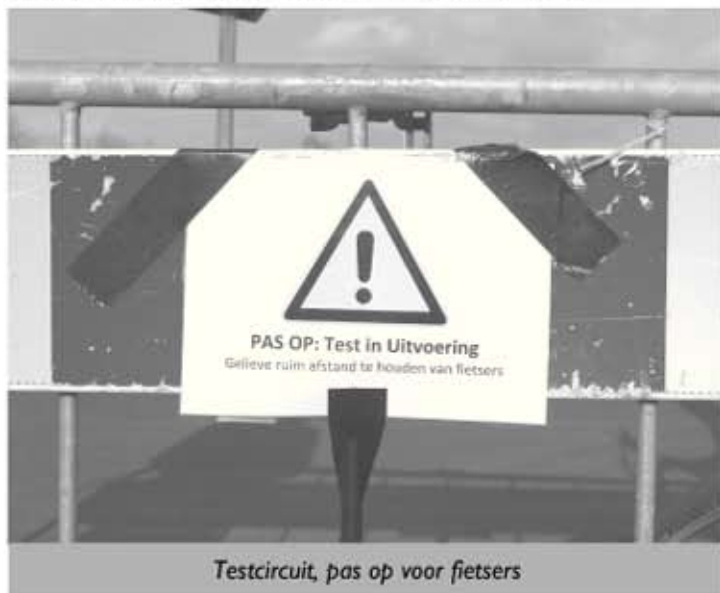
Testcircuit, pas op voor fietsers

Zo vestigde bijna 50 jaar geleden Volvo een kantoor en een ontwikkelingslocatie in Helmond op het bedrijvenpark Groot Schooten aan de westkant van de stad. Daar zijn toen onder andere de Volvo's 440, 460 en 480 getekend en getest. Na het vertrek van Volvo vestigden zich diverse bedrijven op Groot Schooten met eveneens een sterke binding met