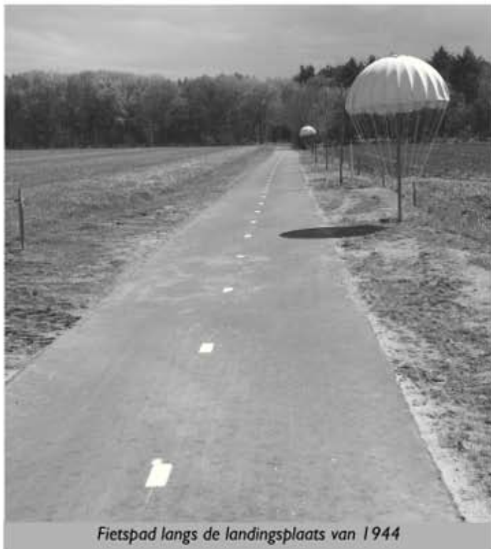
Fietspad langs de landingsplaats van 1944

Afgelopen jaar is de fietsroute parallel aan de A50 vanaf het industriegebied Ekkersrijt (Brug Houtens) doorgetrokken tot aan Sonniuswijk. Zo kunnen fietsers gemakkelijker van Ekkersrijt naar Sint-Oedenrode fietsen. Ook de fietsknooppuntenroute (van knooppunt 41 naar 30) is al aangepast. Alleen het gedeelte bij het Oud Meer (Dutmellapad) is nu jammer genoeg nog wel heel smal en vaak modderig. Naast het nieuwe (brom-)fietspad zijn de parachutes van "Remember September 2014" geplaatst. Op deze plek zijn namelijk de parachutisten op 17 september 1944 geland om de brug over het kanaal te veroveren op de weg van Eindhoven naar Arnhem.