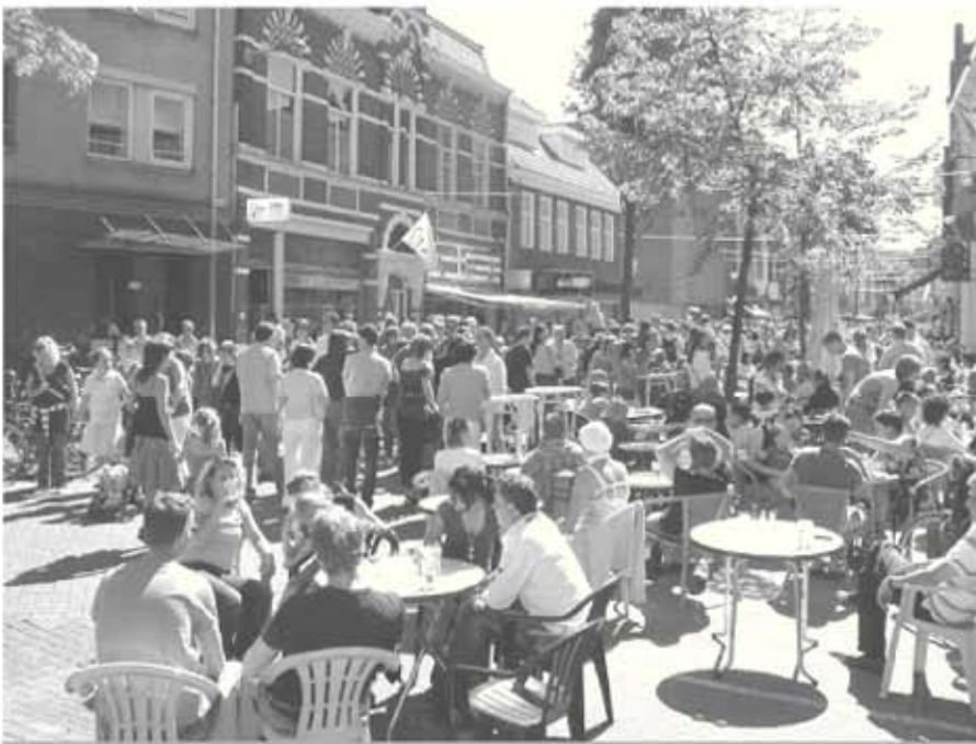
Kleine Berg tijdens Montmartre in de Bergen

Vanuit de kerngroep is er geen bezwaar om de Kleine Berg primair in te richten op wandelende mensen mits er een goed alternatief komt voor fietsers, in casu het opwaarderen van de fietsverbindingen via de Grote Berg en verder: het tracé van station - Vestdijk - Catharinaplein - Grote Berg - Hoogstraat vice versa. Los van het doorgaand