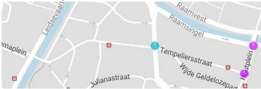
1° Emmastraat - Tempeliersstraat 2006-2010: