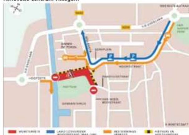
Renovatie centrum Hillegom

nog steeds niet uit. Met de Fietsersbond-afdelingen Heemstede, Hoofddorp en Bloemendaal hebben we enkele jaren geleden afgesproken dat we geen formeel standpunt pro of contra innemen, maar dat we ons zullen laten horen zodra het tracé bekend is. Dan willen we namelijk de consequenties voor de bestaande fietsverbindingen en de opties van nieuwe fietsverbindingen in kaart brengen. Een van de mogelijke tracés kruist de N208 ter hoogte van de Weerlaan. Hillegom had daarom de mogelijkheid van verkeerslichten op dat punt opengelaten. Nu wil de gemeente niet langer wachten. In de renovatieplannen van de N208 is nu toch een rotonde opgenomen. Daarvoor hebben wij ons als Fietsersbond altijd sterk gemaakt.