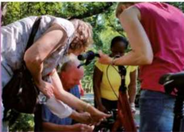
Jubileumfietstocht: Ook in 2016 plakken we nog banden.

Omdat de 15e fietscursus was afgerond, werd een fietstocht georganiseerd, van Hillegom tot Elswout, zoveel mogelijk door bosgebieden (dat zijn er nog heel wat). Voor deze tocht waren alle ca 85 cursisten uit het verleden uitgenodigd; helaas deed slechts een handjevol mee. Naast werk, kinderen opvangen, en dergelijke was waarschijnlijk de belangrijkste reden dat men zo'n kleine 30 km niet 'maar even' fietst. Cursisten vertonen zich vaak fietsend in het dorp voor de boodschappen en zo, maar toeren? Te ver! Tot de eerste pleisterplaats, de Plantage, reed onze burgemeester mee, die daar bij wijze van verrassing iedereen vrij hield: het was immers een jubileum!