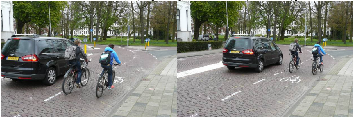
Bocht Kinderhuisvest naar het Kenaupark:

Auto haalt fietsers in, maar weet dat hij de fietsers voorrang moet geven en houdt snelheid in. In de nieuwe situatie gaat auto met volle snelheid rechtsaf en hoeft hij niet op de fietsers te letten. Immers rechtsaf krijgt straks voorrang.