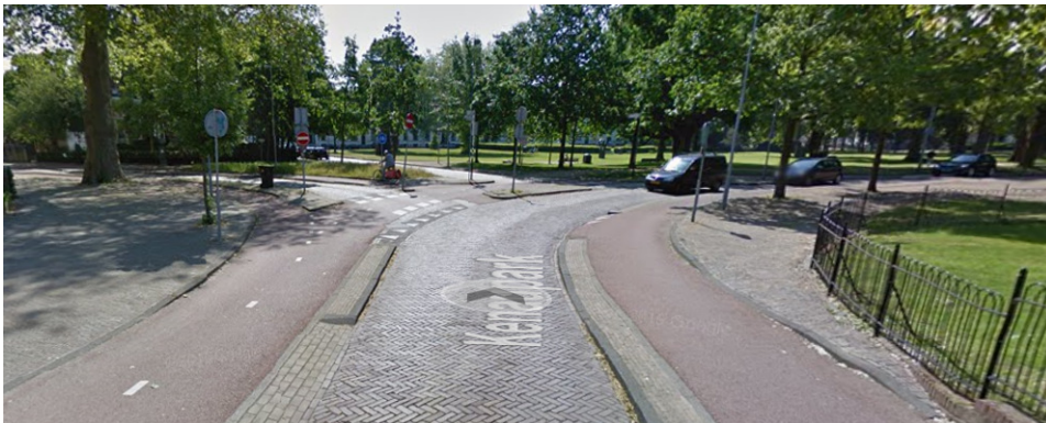
Links de Rozenstraat. De Rozenstraat wordt hier afgesloten. Fietsen naar het station? Hoe nu verder?