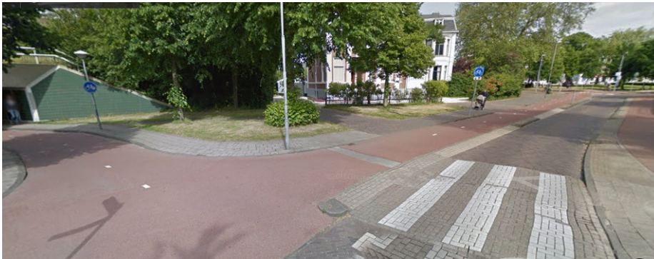
Kenaupark vanaf de Kinderhuissingel. Links de Franklin Hoevens fietstunnel. Richting Rozenstraat worden de fietspaden aan beide zijden van de weg opgeheven. Fietsers moeten straks tegen de autostroom in (nl. éénrichtingsverkeer) over de weg.