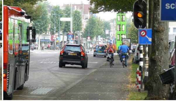
Plan B, het alternatief van het college: Op marktdagen wordt het fietspad op het schelpenpad (rechts van de bomen) afgesloten. Het huidige aanliggende fietspad verdwijnt. Op marktdagen moeten fietsers tussen het (bus)verkeer op de weg.