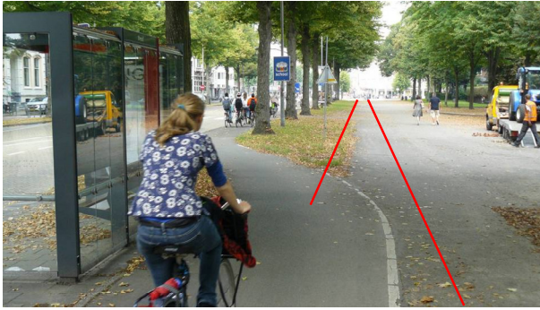
Plan A, collegevoorstel. Het huidige fietspad op de Dreef. De 'slinger' gaat er uit. De rode lijnen geven aan waar het nieuwe fietspad zou komen te liggen.