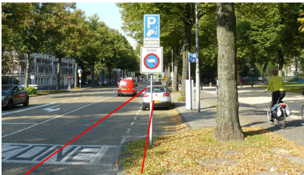
Plan C, veilig alternatief van de Fietsersbond: Leg het nieuwe fietspad aan de andere zijde van de bomenrij door de rijbaan te versmallen.