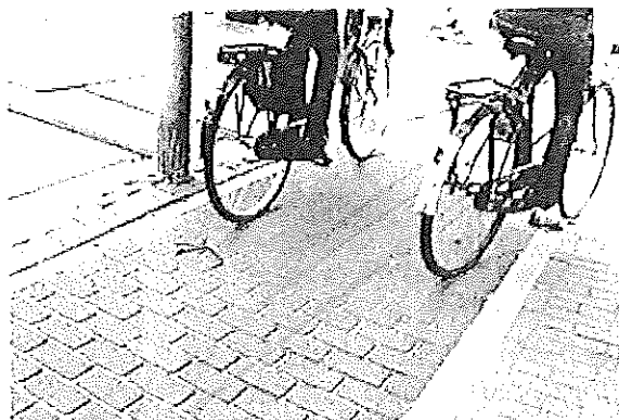
Gedempte Oude Gracht: wel asfalt, maar uitgevoerd als nepklinkertjes. Niet onze voorkeur....

Kinderhuissingel: fietspad langs de waterzijde zou in klinkers moeten. Gemeenteraad greep in en maakte er asfalt van.