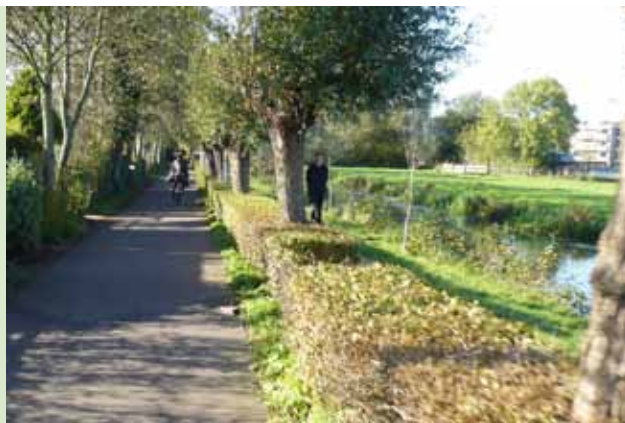
Schoterkerkpad, links fietspad en rechts voetpad.

Verder is het ook nog de goedkoopste oplossing, en het past in het bestemmingsplan. Er komt een fietspad aan de andere kant van de heg, net zoals het Schoterkerkpad tussen de Jan Gijzenkade en Santpoort-Zuid . De bruggetjes worden lager, zodat ook ouderen en mindervaliden gebruik kunnen maken van deze route. Met de komst van kinderdagverblijf " Uk aan Zee " en het feit dat een derde van de leerlingen van de Beatrixschool aan de oostzijde van de Randweg woont, is de aanleg van