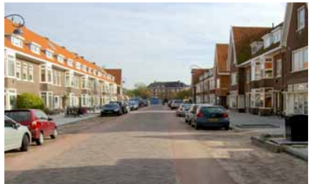
Stuyvesantstraat na de herinrichting, met rood asfalt voor comfortabele fietsstroken.