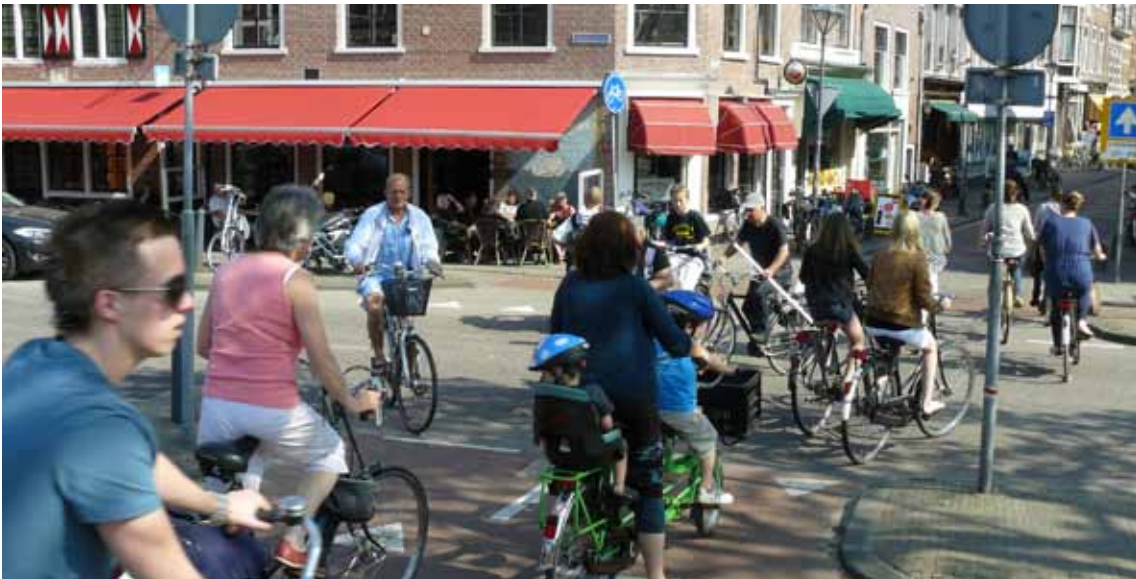
Veel voorkomende situatie op de Zijlbrug naar de Zijlstraat: Fietsers die de oversteek 'wagen'. Veel ouderen en mensen met jonge kinderen die zelfstandig fietsen stappen af en nemen het zebraapad.