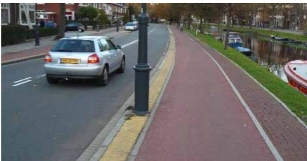
Kinderhuissingel schampstrook met lantaarnpaal is 56cm.

45 cm? Huh, zo dik? Wij gingen de straat op en maten dezelfde soort lantaarnpaal die overal in de stad verrijst. Tot onze verbazing gaf onze centimeter het getal 32,5 cm aan! Op de Kinderhuissingel staat zo'n paal in een schampstrook van 56 cm. En het fietspad is daar 2 meter.