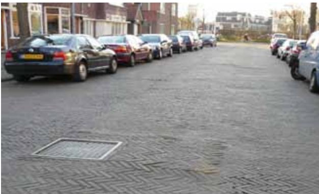
Stuyvesantstraat voor de herinrichting.

Rotonde Briandlaan: heeft rode fietsstroken gekregen. Een echte rotonde blijft onze wens.