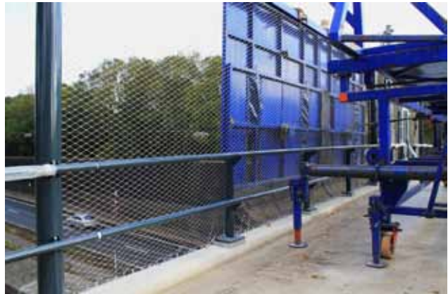
De uiteindelijke fiets-, en voetgangersbrug in aanbouw € 270.000.

Om te voorkomen dat vandalen spullen vanaf de brug op de eronder liggende snelweg kunnen gooien, krijgt de brug een speciaal veiligheidsnet.