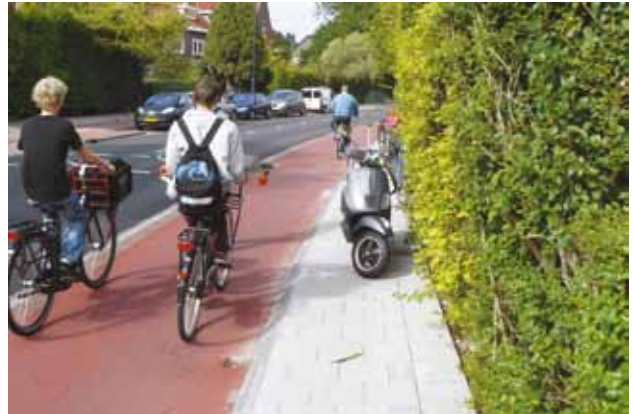
Julianalaan: voetpad met scootmobiel

De asfaltweg is vervangen door twee rode asfalt fietsstroken en een smalle rijloper van klinkers.