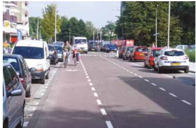
Ter vergelijking: de Italiëlaan.

Het voorstel van de wijkraad, bewoners en Fietsersbond is een inrichting die al ligt op de Altenastraat en de Italiëlaan met asfalt fietsstroken (2 meter) en een rijloper van klinkers (2,5 m). Zie foto.