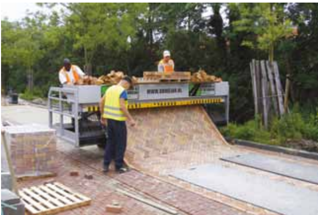
De Parnassiakade, één groot fietspad met auto's te gast op het fietspad; links de bestratingsmachine.

Na een hoop touwtrekken is vorig jaar besloten om de Parnassiakade uit te voeren als fietsstraat met strengpersklinkers. In de zomer is voor fietsers "letterlijk" de looper uitgelegd. Geen stratenmakers die op hun knietjes de stenen tegen elkaar leggen maar een bestratingsmachine die het wegdek in één keer uitrolt. In de toekomst geeft deze fietsstraat aansluiting op de geplande fietspad langs de Houtvaart richting Coornhert Lyceum en station Heemstede-Aerdenhout.