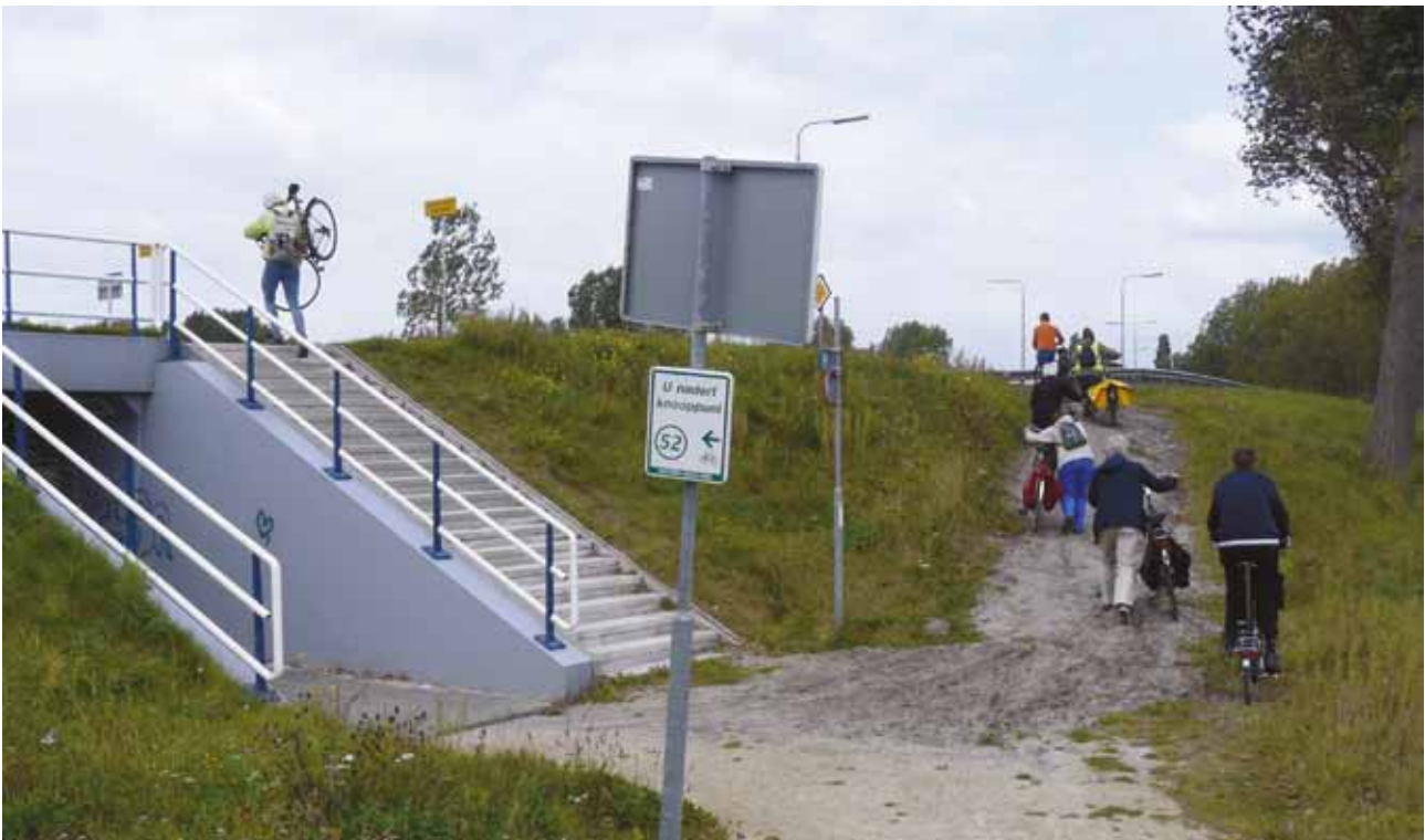
Op weg naar de tweede pont: Klunen via de trap of over een zandpad bij Heemstede

Stiekem hopen we dat Yvonne, die haar afscheid vandaag had aangekondigd, volgend jaar toch weer de tocht zou willen organiseren. Ze weet zulke leuke fietsroutes te bedenken en vindt het zo leuk om te doen... Daarover en over de redenen om afscheid te nemen, leest u meer in het interview dat wij met haar hadden.