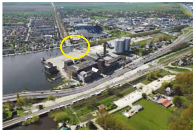
In het gele ovaal is de brug gebouwd, het nieuwe station ligt aan de overkant van Sugar City langs de snelweg.