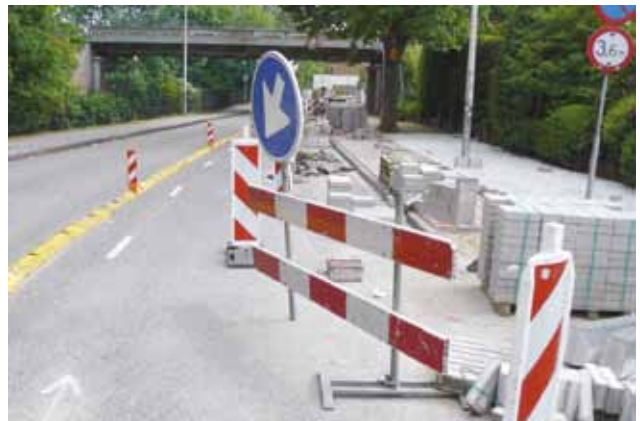
Tegels voor het fietspad op de Julianalaan.

Dan de tegenvallers: we betreuren het dat de gemeente met het afwijzen van een fietsbrug als ontsluiting voor het Haringbuysterrein, opnieuw het algemeen belang van fietsers ondergeschikt heeft gemaakt aan het belang van een groepje bewoners. Te meer omdat de brug er al ligt; dat is de brug over de Houtvaart waar vroeger de blauwe tram overheen reed. En jammer dat er toch tegels op het fietspad van het nieuwe stuk Julianalaan zijn gekomen. Aan de kant van het water was dat onvermijdelijk omdat de zware asfalteermachines daar een gevaar zouden vormen voor de in slechte staat verkerende kademuren. Maar aan de westkant was er geen reden om tegels te leggen. Asphalt op fietspaden zit in Bloemendaal nog steeds niet tussen de oren! Ook is het