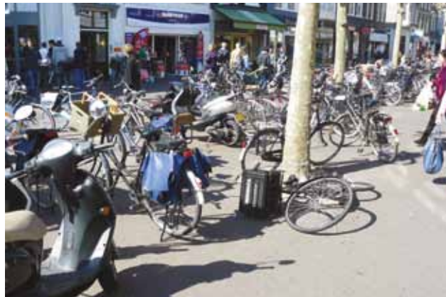
'Geparkeerde' fietsen op de Grote Houtstraat.

D66, PvdA, en VVD willen – tegen beter weten in – twee richtingen autoverkeer op de Waarderbrug met een regeling zoals op de Catharijnebrug: een om-en-om regeling. Dat betekent dat er een overbelast kruispunt wordt toegevoegd aan de Spaarndamseweg. Gevolg: lange wachttijden (2 minuten), niet alleen voor fietsers, maar ook voor auto's. De SP en OPH willen nog verder gaan: een aparte fietsbrug naast de Waarderbrug. Maar die brug kost meer dan 4 miljoen en helpt de fietser niet, die brug komt er alleen voor het gemak van automobilisten uit de Indische buurt.