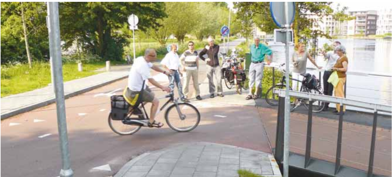
Schouw - krappe bocht bij fietsonderdoorgang Buitenrustbruggen