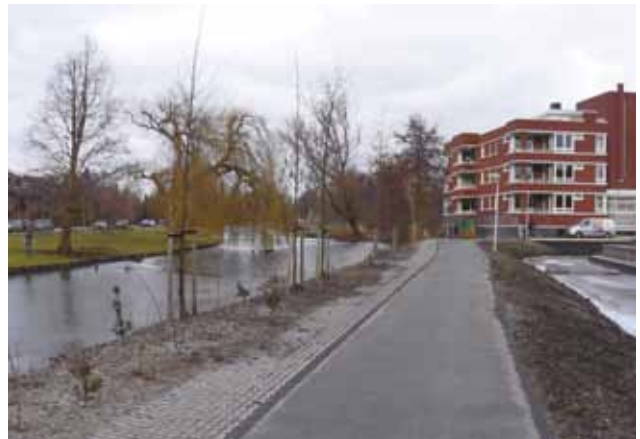
Pontje in plaats van bruggetje?

Ten slotte feliciteerde hij mij met het fietspad dat Aerdenhout met het Coornhert Lyceum, de wijk Vogelpark en station Heemstede-Aerdenhout gaat verbinden. Alleen vond hij het traject nogal gekunsteld en fietsonvriendelijk, zo vlak langs de Randweg. Daarom, zo vertelde hij enthousiast, gaat hij pontbaas worden op de Houtvaart, in het verlengde van de Rijnegomlaan. Het gaat de P-pont heten. Er