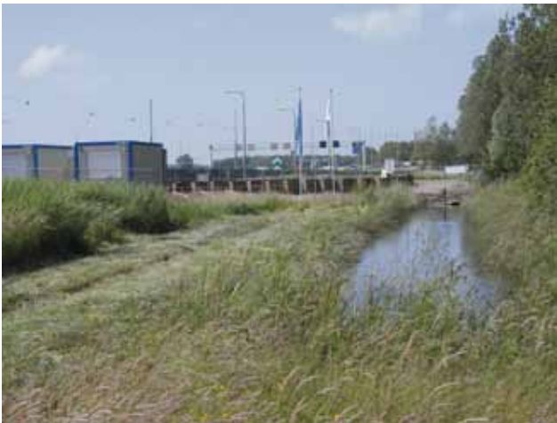
De damwand voor de CRM tunnel is geslagen.

Het zogenoemde Olifantenpad, de afsteek Vels Traverse - Emplacementsweg in Velsen-Noord is geëgaliseerd, verhard en gelegaliseerd. Men rijdt nu zonder omwegen direct naar station Beverwijk en verder.