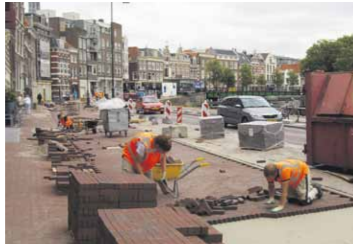
Spaarne (tussen Gedempte Oude Gracht en Melkbrug)