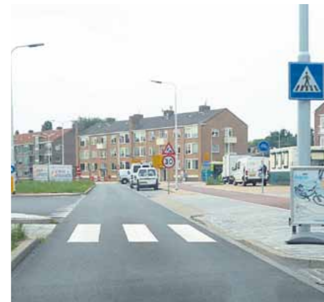
Voorbeeld: Planetenweg HOV-deelproject 9

De vormgeving van de toekomstige fietsroute die evenwijdig loopt aan de HOV-route, is inmiddels deels uitgewerkt in de route langs de Planetenweg (HOV-deelproject 9). Op de foto is duidelijk te zien dat er gekozen is voor een smalle autoroute met vrijliggende extra brede fietspaden, een breed trottoir, parkeren tussen de autoweg en fietspaden en een middeneiland voor de overstekende voetganger. Tevens zijn er diverse faciliteiten voor het fietsparkeren aangebracht. Het fietsgebruik wordt hierdoor zeker gepromoot. Een belangrijk punt, zeker gezien de toekomstige reconstructie van het winkelcentrumgebied Lange Nieuwstraat. Vrijliggende fietspaden, gescheiden verkeersstromen, smalle rijbanen waardoor de snelheid 'eruit gehaald' wordt en een middeneiland zullen de veiligheid van alle verkeersdeelnemers ten goede komen.