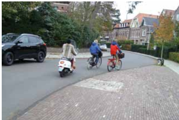
De 'slinger': Bloemendaalseweg

De Fietsersbond blijft inzetten op het verwijderen van de slinger. In plaats daarvan willen we een verkeersplateau aanbrengen op het kruispunt om zo de snelheid van de auto's af te remmen.