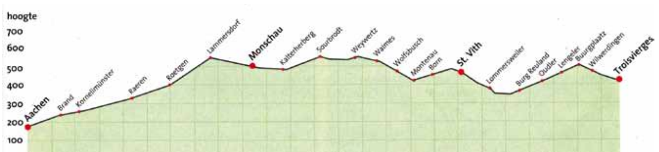
Schema onder: Overzicht van fietsroute Vennbahn met hoogteverschillen