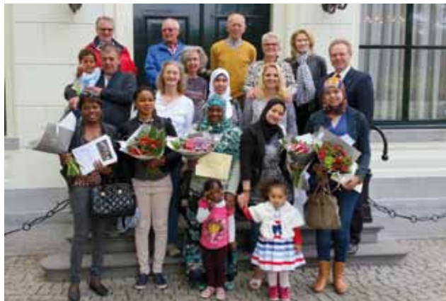
Geslaagden van de cursus in juni met hun familie en begeleiders

Alweer voor de veertiende keer draait er in Hillegom een fietscursus: tien lessen praktijk, vier lessen theorie. Toen we zeven jaar geleden begonnen hebben wij, leden van de afdeling Hillegom van Veilig Verkeer en van de Fietsersbond, les gehad van ervaringsdeskundigen uit Tilburg. We leerden er hoe we fietsles moesten