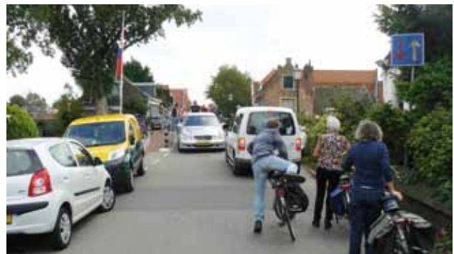
Opstopping bij versmallingen op de IJdijk. Bewoners willen de versmallingen bij de bruggen behouden. Die versmallingen zijn echter obstakels voor fietsers, niet voor auto's.

De Fietsersbond wil nog een stap verder gaan. Met het toenemend verkeer als gevolg van het komst van SpaarneBuiten, zou een deel van de smalle dijk eigenlijk parkeervrij moeten worden gemaakt. Op deze wijze kan voor fietsers de beste veiligheid geboden worden. Om dat te realiseren, moet een parkeerterrein nabij de Kerklaan worden aangelegd. Deze al heel oude wens van de Dorpsraad kost echter geld. De Fietsersbond denkt dat met subsidiemogelijkheden wel geld te vinden is. Dat moet de gemeente dan wel willen!