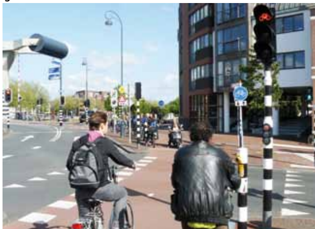
Wachten bij de Verfroller. Voetgangerslicht staat op groen, fietsers hebben rood.

In haar brief stelt de wethouder voor om een eventuele herziening van de verkeerslichtennota uit te stellen tot na de vaststelling van de 'Structuurvisie Openbare Ruimte'. Dat is volgens ons verkeerd, want dan ga je repareren met verkeerslichten wat je met goed beleid zou moeten doen. Een goede VRI-nota kan input leveren aan de verkeersstructuur. Moussa Aynan (PvdA) stelde voor om de verkeerslichtennota te agenderen in samenhang met het fietsplan regionale bereikbaarheid en de overeenkomst met Vialis, hetgeen breed werd gesteund. Alleen de VVD steunde de wethouder in de