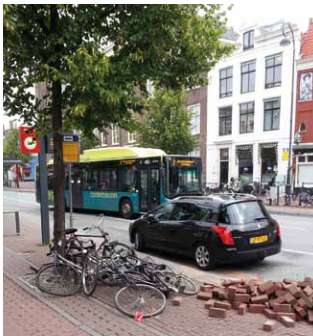
Fietswrakken en fietsen die langer dan vier weken in de rekken staan worden, nadat zij zijn gestickerd, weggehaald. Deze stapel ligt klaar om afgevoerd te worden naar Cruquius. De eigenaren van de weesfietsen kunnen hun fiets desgewenst ophalen bij Paswerk in Cruquius.

De door de wethouder ingestelde werkgroep Fiets heeft inmiddels een hoop werk verzet. Er zijn plannen gemaakt voor het Raaksgebied, de kop van de Grote Houtstraat, Zijlstraat - Nieuwe Groenmarkt en rondom de Botermarkt. De 'adviezen' liggen nu bij de wethouder. Er is 100.000 euro beschikbaar, waarvan de helft gesubsidieerd wordt door de provincie.