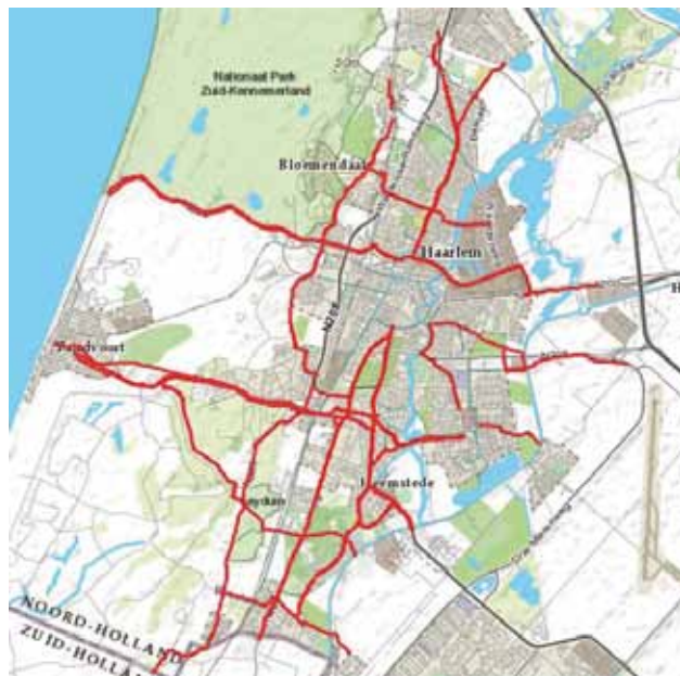
Het voorgestelde regionale fietsnetwerk Zuid-Kennemerland. De stadscentra zijn 'blinde vlekken'.

De Fietsersbond heeft bezwaar ingediend tegen de omgevingsvergunning voor de bouw van Outlet Sugar City vanwege de conflicten, die zullen ontstaan tussen het fietsverkeer op de te realiseren snelfietsroute en het autoverkeer van en naar de Outlet. Omdat de gemeente Haarlemmerliede en Spaarnwoude te laat heeft gereageerd op de aangevraagde omgevingsvergunning voor de bouw van de outlet is deze vergunning 'van rechtswege verleend'. Dat is toch wel merkwaardig. Wie zich de gang van zaken rondom SpaarneBuiten nog kan herinneren, kan zich afvragen of de gemeente nog wel voldoende tegenwicht biedt aan projectontwikkelaars. De gemeente werkt samen met de gemeentes Haarlem en Amsterdam aan de realisatie van de snelfietsroute Haarlem-Amsterdam-West, de F200. Nu blijkt echter dat dit fietspad langs de Haarlemmerstraatweg helemaal niet meer voorkomt op de ontwerptekeningen van de verkeerssituatie rondom de outlet. De inrit naar de parkeergarage onder de outlet komt direct te liggen op het