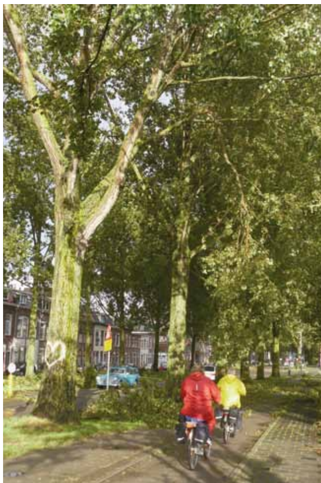
Westergracht na de storm. Fietzers wagen zich onder de halfafgebroken takken.

Voor het project ‘fietspad naast het Houtmanpad’ zijn nieuwe voet- en fietsbruggen gemaakt. De Kwakelbrug zou vervangen worden door twee lage bruggen, een smalle voetgangersbrug en een iets bredere fietsbrug. Deze liggen in de opslag. Een aantal bruggen wordt nu ingezet om slechte bruggen op het pad te vervangen. De beoogde Kwakelfietsbrug wordt nu ingezet voor de vervanging van de Schoonoordbrug verderop langs het Houtmanpad. De nieuw gemaakte Kwakelvoetbrug heeft geen bestemming, blijft dus over en zou dus prima ingezet kunnen worden ter vervanging van de Kwakelbrug.