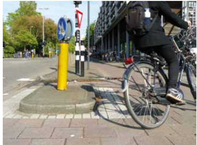
Kennemerplein. Regelmatig schampen fietstrappers onnodige obstakels op het fietspad.

Arcadis zag dit evenwel anders: "Hoogteverschil tussen trottoir en fietspad is ons inziens van belang voor de veiligheid." Arcadis wilde zelfs een extra verkeersheuvel