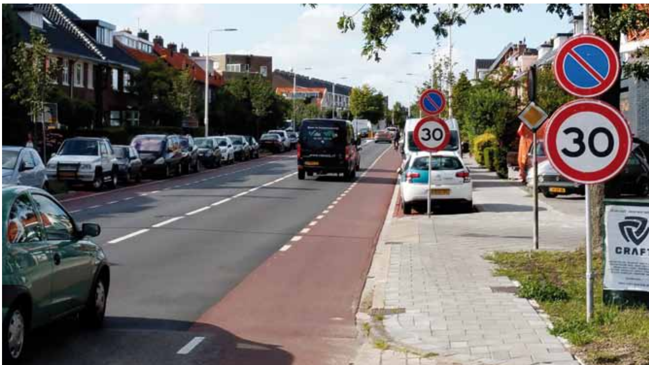
Santpoort, Broekbergenlaan. De aanpassing die de Fietzersbond Velsen noodzakelijk vindt, is uitgetest tijdens de Feestweek. Wij vinden de test geslaagd.

Velsen-Noord gaat meepraten over de aanpassing aan de Grote Hout of Koningsweg. De snelheid wordt tussen de spoorovergang en de aansluiting op de Wenckebachstraat 30 of 50 km/uur. De Fietzersbond Velsen neemt deel middels de inspraak.