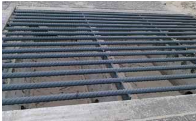
Veerooster in Nationaal Park Zuidkennemerland

"Tijdens een trainingsrit onderuit gegaan. Gebroken hand, oogkas en bovenkaak opgelopen. En ook een hersenschudding. Het lijkt erop dat het stalen oppervlak gepolijst is door de vele fietsbandjes die hier dagelijks overheen gaan." (M.S)