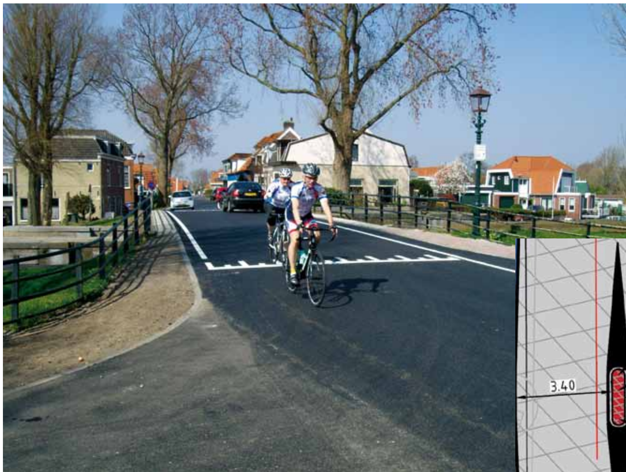
Foto boven - zwart asfalt, nog zonder de versmallingen.

De Fietsersbond hoopt er het beste van...