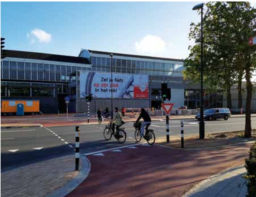
De oversteek richting de fietsflat die nu ook richting centrum gebruikt kan worden.

Het Kennemerplein is sinds kort opgeleverd. Na een chaotische periode met omlidingsroutes door het park, liggen er nu mooie geasfalteerde fietspaden op deze drukke fietsroute.