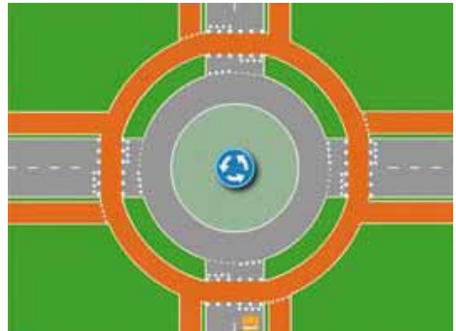
Zocherrotonde actueel CBRB (links boven) versus Enkelstrooksrotonde (rechts boven, een schematisch plaatje van een rotonde). Zoek de verschillen!

De platte rotonde dwingt automobilisten op de Brederodelaan onvoldoende om hun snelheid te verminderen. Vooral het verkeer van noord naar zuid kan bijna 'rechtstandig' doorrijden. Bovendien is het verkeer overwegend noord <-> zuid en zuid <-> noord zonder veel (conflicterend) dwarsverkeer. De fietsoversteken maken geen deel uit van de rotonde, liggen niet binnen vijf meter vanaf de rotonde en vormen solitaire oversteken.