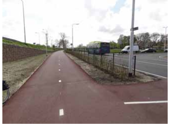
Doorgaande fietsroute richting Haarlem.

Het fietsverkeer is toegenomen zowel via de sluizen als de pontveren. De Fietsersbond hoopt op een gezonde voortzetting van deze fietsverbinding met blijvende extra afvaarten in de spitsuren.