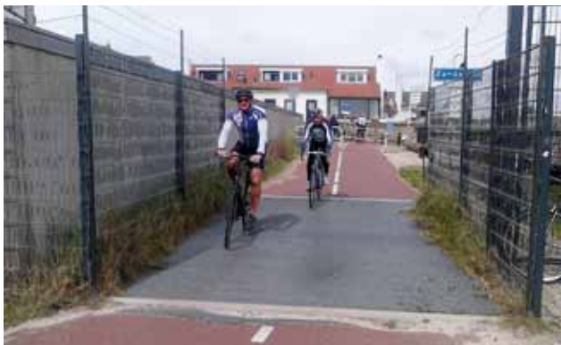
Wildrooster in Zandvoort

De Fietzersbond hoopt dat Waternet een van onze voorstellen overneemt en dat vervolgens niemand in Zandvoort meer 'op zijn plaat' gaat.