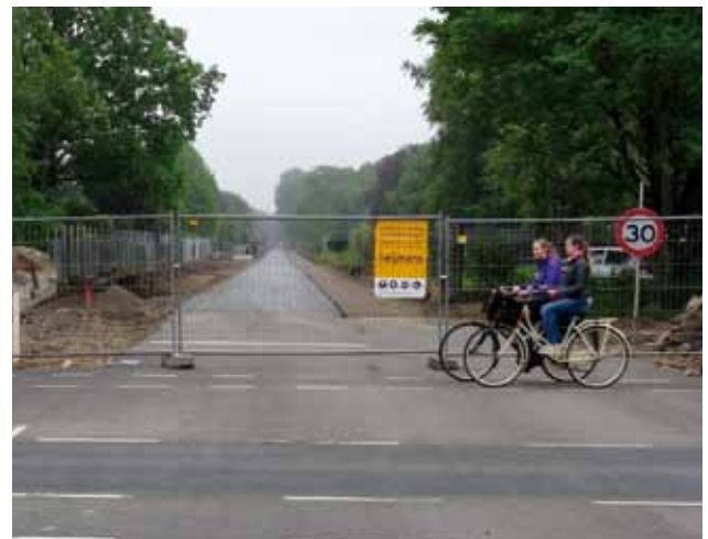
HOV-trajact tussen de Zeeweg en de begraafplaats Westerveld. Achter het hek (rechts en links) het begin van het nieuwe fietspad.

Een project waar op dit moment flink aan gewerkt wordt, is het gedeelte van de HOV tussen IJmuiden en Santpoort-Noord. Die loopt via het oude tracé van de spoorlijn naar IJmuiden. De plek waar het fietspad tussen de Zeeweg en de Begraafplaats Westerveld komt, is al te zien.