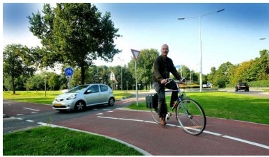
De nieuwe oversteek in Zwijndrecht: auto's hebben hier nog altijd voorrang.