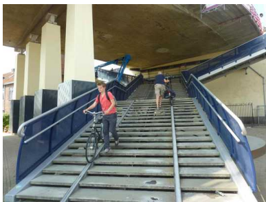
De trappen van de Zwijndrechtse brug zijn het beginpunt van de snelfietsroute.