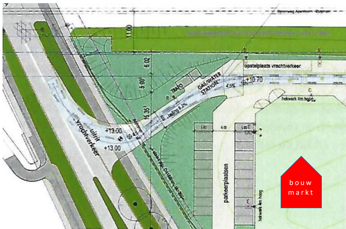
AFB 1: Aansluiting vrachtverkeer Laan van Erica (uit Rapport van Goudappel Coffeng, fig 2.2).