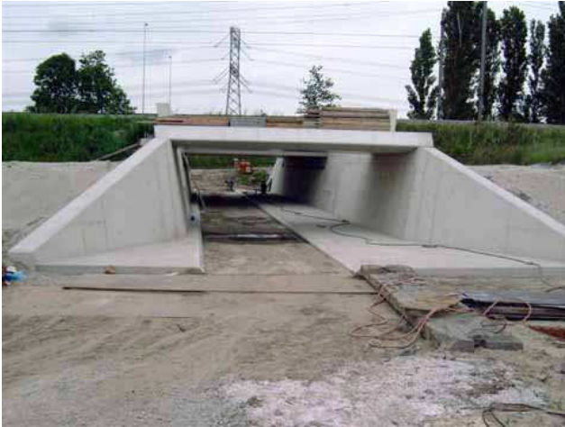
FIETSTUNNEL ONDER DE A12 BIJ DE ROTTE