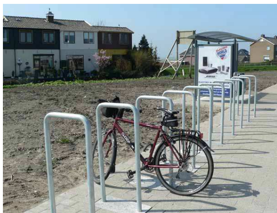
Fietsvoorziening bushalte rotonde Klapwijkseweg - Oudlandselaan: nu mooi geregeld!