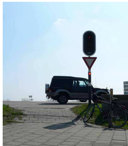
Oversteek N209 Oosteindseweg: een killer