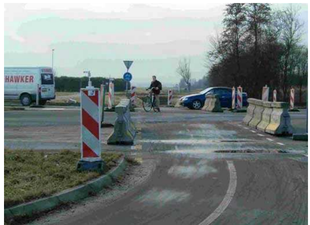
G.K. van Hogendorpweg: waar moet de fietser voorrang aan de auto's verlenen?

Ondanks het verzoek van de afdeling 3B-hoek aan de projectorganisatie N 470 om tijdens de bouw zorg te dragen voor een veilige en zoveel mogelijk ongehinderde passage van fietsers over het tracé zijn in het afgelopen jaar bij herhaling problemen gesignaleerd bij Zoetermeer, Kleihoogt, Klapwijkseweg, Rodenrijseweg en G.K. van Hogendorpweg.