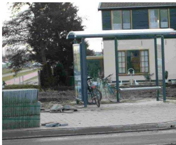
Fietsvoorziening rotonde Klapwijkseweg - Oudlandselaan Foto PM

Wel zielig voor de buspassagiers die nu in regen en wind moeten staan als de stalling vol is met fietsen. Maar ja, die fietsen staan er vaak een hele dag dus een beetje bescherming is niet voor niets. PM