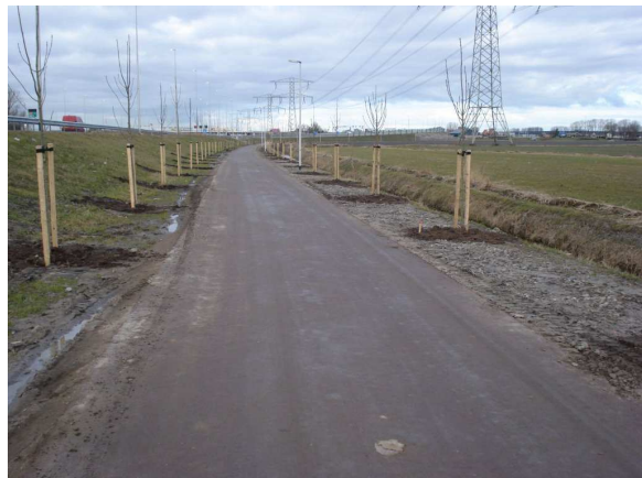
Het fietspad langs de A12