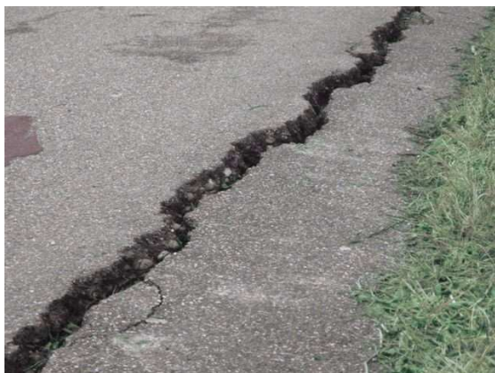
zo was het